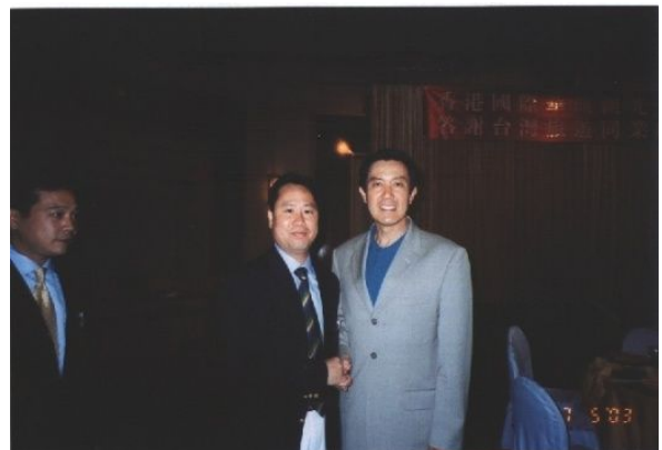
IARFP 亚太区副主席林荣利教授与台湾省马英九先生(右一)合影