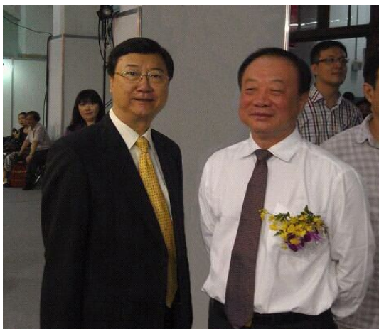
IARFP 亚太区主席冼伟超教授与广东省副省长宋海先生(右一)合影