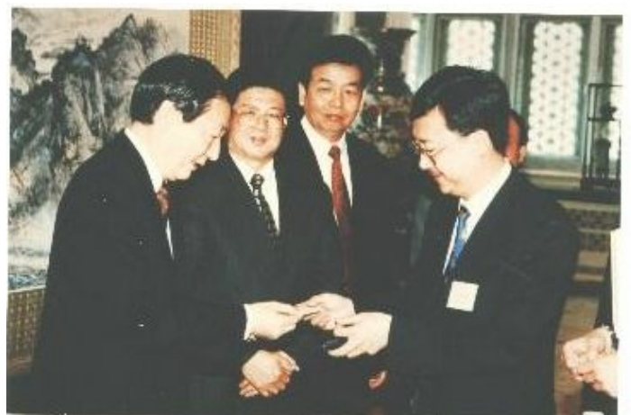
IARFP 亚太区主席冼伟超教授与前国务院总理朱镕基先生(左一)合影