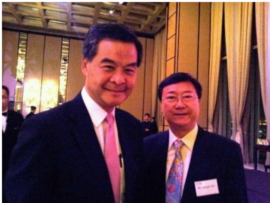
IARFP 亚太区主席冼伟超教授与香港特别行政区特首梁振英先生(左一)合影

深入推进 CEPA 政策第六条关于服务及教育认可办法的实施，由香港特别行政区、香港金融业界各会员单位以及国际财务策划师公会 IARFP（中国）代表处资助的《在粤在校港、澳、台籍高校学生攻读“国际财务策划师”IARFP 课程资助计划》（下称该计划）即日起至 2012 年 11 月 10 日前，成功申请该计划的学生，可以“ 全免费 ”参加 IARFP 课程学习，上课地点设在广州市华南理工大学校内，本次支助名额为 200 名。详情请浏览 www.iarfp.org.cn